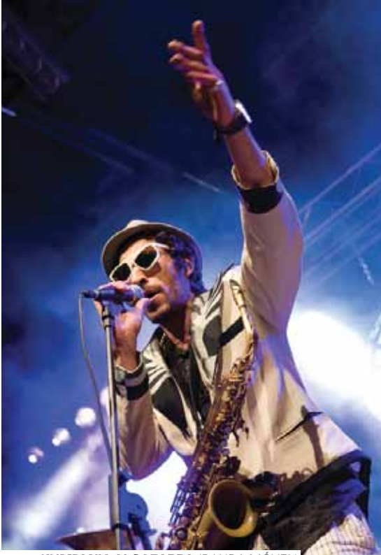
KUMPANIA ALGAZARRA (BANDA MÓVEL)